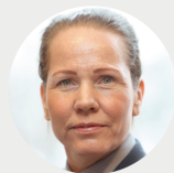
Sjef Forsvarets fellestjenester (fung.) Oberst Evy Linchausen Skar