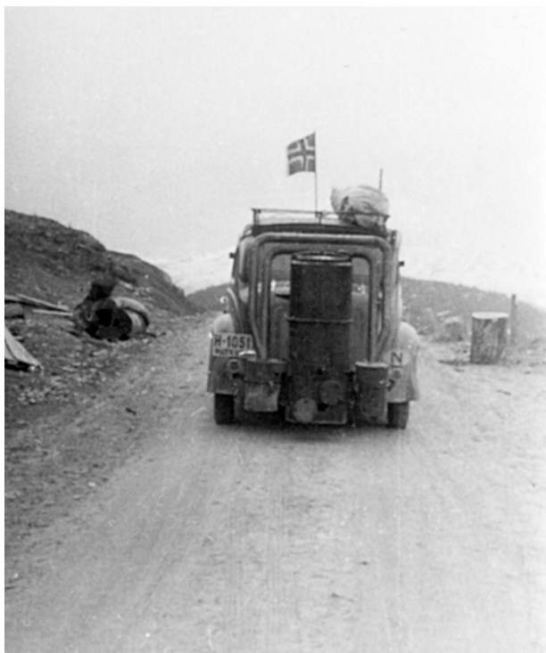
Bilete frå frigjeringa i Rauland 1945.