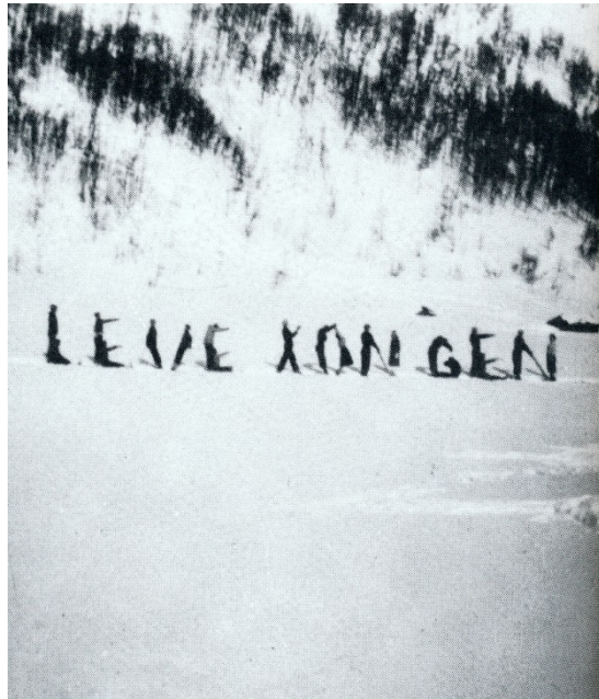
Arabønder som demonstrerer på denne måten i Tjønndalen.

For Noreg som samfunn er oppfølging av veteranar sine levekår og generell heider for deira innsats eit større tema. Planen for Vinje kommune sitt vedkomande er avgrensa til å omhandle lokale tiltak for å synleggjere det ærefulle og respektfulle oppdraget å ha tenestegjort for landet.