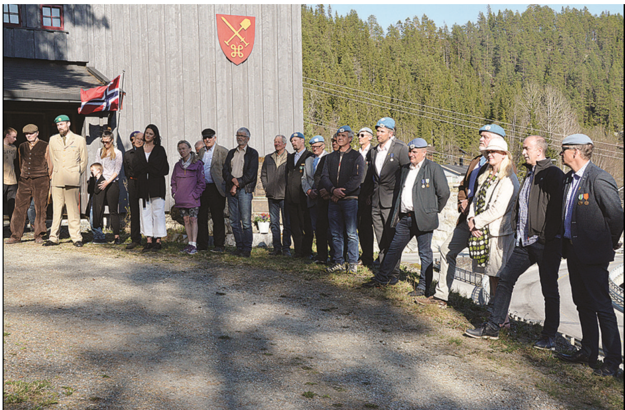
Veteranar m. fl. samla ved Forsvarsmuseet i Åmot 8. mai 2018.

⇒ NROF - Norske Reserveoffiserers Forening